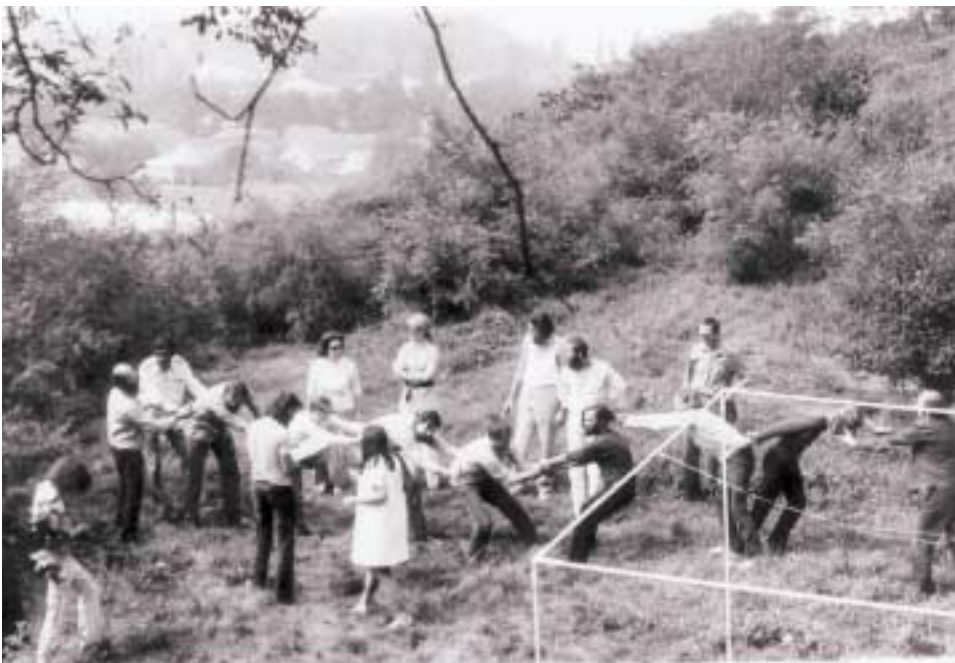
Cseh, szlovák és magyar művészeti találkozó, Balatonboglár, 1972

Fenn kell tartani egy családot. Erre tökéletesen alkalmasnak tartom magam. Büszkeség nélkül