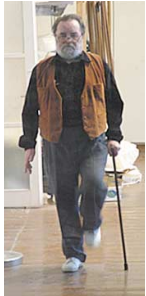
Járni tanulok, 2006