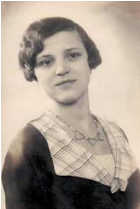
Anyám 1929 körül

Első élményeim néhány hónapos koromból származnak. Anyám nővére nálunk lakik. Bejön a sötét szobába, ahol mély feketeség uralkodik. Kékesen világít az ablak. Az égbolt látszik, háztetővel és kéményekkel. Nagynéném felkap az ölébe, és magához szorít. Hatalmasak a mellei. Karácsony lévén, egy mákos bejgliből leharap egy kis mákot, és beledugja a számba. Ringat, ringat, és azt énekl, hogy lalalalalla-lallalalalla. Kicsit karáydyan. Ez is háborús élmény.