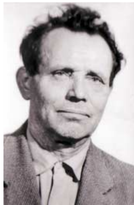
Apám 60 évesen

A pályaudvarokat úgy építik, hogy nagyobb fogadásokra is alkalmasak legyenek. Nemzetközi találkozók jönnek létre a Keleti pályaudvaron. A lépcsőre vörös szőnyeget gurítanak ki. A lépcső tetején egyszer csak megjelenik a walesi herceg anyám szerint. Hintókkal lehet közlekedni a környező kerületekbe, a macskaköves utcákon. A házak belül topisak, igénytelenek, de a külsejük díszes, még a legkisebb, legvacakabb mellékutcákban is.