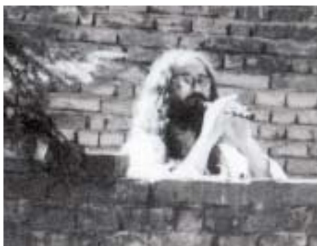
Kaposvári idill, 1977 körül

Erkel Színház. Gyönyörű szecessziós képek vannak a homlokzatán, amik szgrafittóval készülnek. Ez azt jelenti, hogy a többszínű malter felületbe belevésik, amit el akar érni a művész. Mozit csinálnak belőle. A mozi, a filmszínház, a filmművészet a leginkább javasolt műfaj, amit próbálnak a közönségnek eladni, mert így el lehet fogadtatni valamilyen központi gondolatot. Nyilvánvalóan az előadások is Moszkvából származnak, mint például a Sztálingrádi csata . Még vetítenek néhány olasz filmet is, mint például a Biciklitolvajokat vagy de Sica-filmeket. Ezeket ott lehet megnézni a tér sarkán. A legnagyobb élményem mindig a színház. Kiáll egy ember, kettő vagy négy, és lenyom neked egy olyan szöveget, amit csak hetek alatt tudnál megtanulni. A felgyorsított gondolkodás, amit a színház tud adni a színházértőnek, engem például küld. Eszembe sem jut, hogy harminc egy-néhány éves koromban én is színházi alkotóvá válok. Nincs benne a pakliban, ez bejön. Folyamatosan tiltakozom ellene egész színházi életem során. Úgy érzem, mintha takarékra ten-