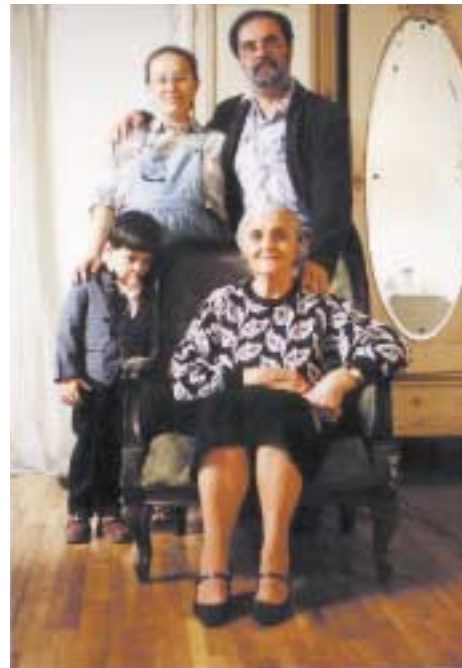
Anyám, Gellért, Emma és én, 1992