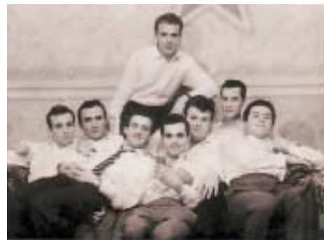
Iskolai találkozó Szilveszterkor az 1950-es évek végén