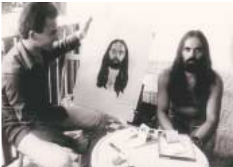
Egy olasz arcképrajzolóval, Nagyatád, 1978

mat. Általános megelégedéssel. Elindulok egy pályán, ami a Kaposvári Színházban csúcspontot ér ki. Itt nem vagyok munkaviszonyban, hanem szerződéseket kötök egy-egy darabra. Nem bukom meg. Sikerem van. Újabb megbízások jönnek. Valamit elvállalok, valamit nem. Sikert sikerre aratok. Csillogok, akár csak a színház, amely zárandokhellyé válik.