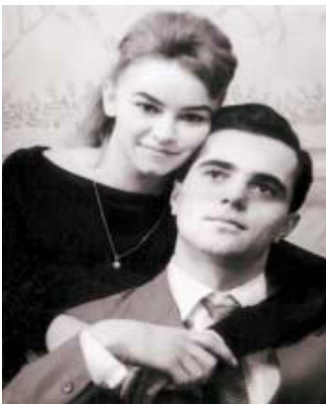
Ancsival az esküvő időszakában

kiadék stílusa megy. Ház sarkához vágom a Kossuth cigarettámat. Könnyű, rugalmas testű, izmos figuraként állok erőkézenállást, einhandot egy gúla tetején, amelyet nyolc-tíz erős tornász tart. Abbahagyom a tornát. Rájövök, hogy másra kell figyelnem, bár nem tudom, mire. Tanult foglalkozásom irányít. Az agyam köt le leginkább. Harmincéves koromra kiolvasom Szerb Antal nyomán a világirodalom remekeit. Mindent tartalmaz, amit tudni szeretnék, de mégis bennem marad a hiányérzet. Erre jön a színház.