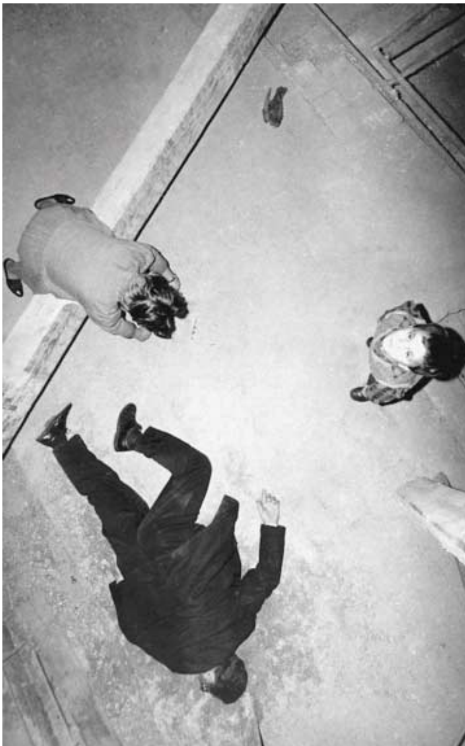
St. Auby Tamás: A Természetes kiválasztódás , 1993, TNPU-Archívum

A rendszerváltás idején egyértelművé válik, hogy szétesik az a birodalom, amelyik bennünket évtizedeken keresztül vegzál. Azt képzelem,