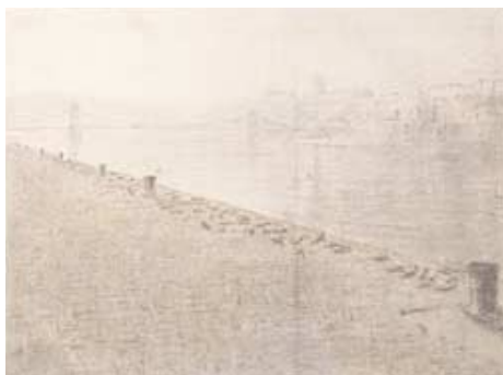
Cipők a Duna-parton , grafika, 2005 (Szjsz511)

Az áldozatok szenvedésére emlékeztető mártíremlékművek sorából Pauer munkája visszafogottságával és szűkszavúságával tűnik ki. A kompozíció legfontosabb eleme maga a helyszín: a mű a drámai helyzetet nemcsak szimbolikusan, hanem ténylegesen is képes felidézni, ugyanis egy valóságos folyó partján található, ahol az embert valós veszélyérzet keríti hatalmába, hiszen nézelődés közben maga is könnyen a Dunába eshet. A néző számára a gazdátlan cipők bizarr látványa minden monumentális szobornál és fennkölt visszaemlékezésnél jobban képes felidézni,