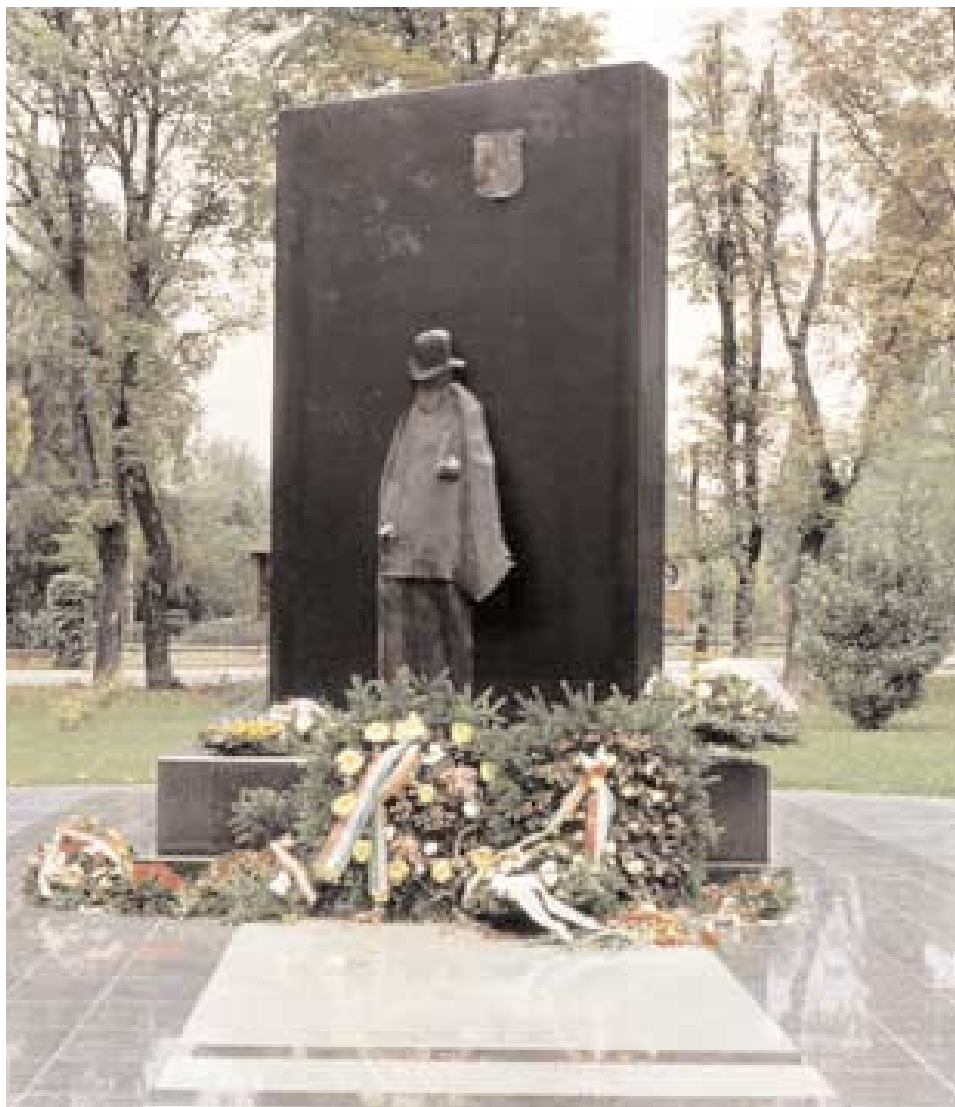
Az 1848–49-es magyar forradalom és szabadságharc 150. évfordulója tiszteletére felállított emlékmű, Budapest, 1998 (Szjsz436)

A mű egyaránt reprezentatív és közérthető, ami első megközelítésben egy avantgárd művésztől – mint amilyen Pauert is ismerjük – talán kissé szokatlan. Jobban megvizsgálva, a mű több problémát felvet. A gránitba beütött, plakátszerű Petőfi-kép a felnagyítás és a más