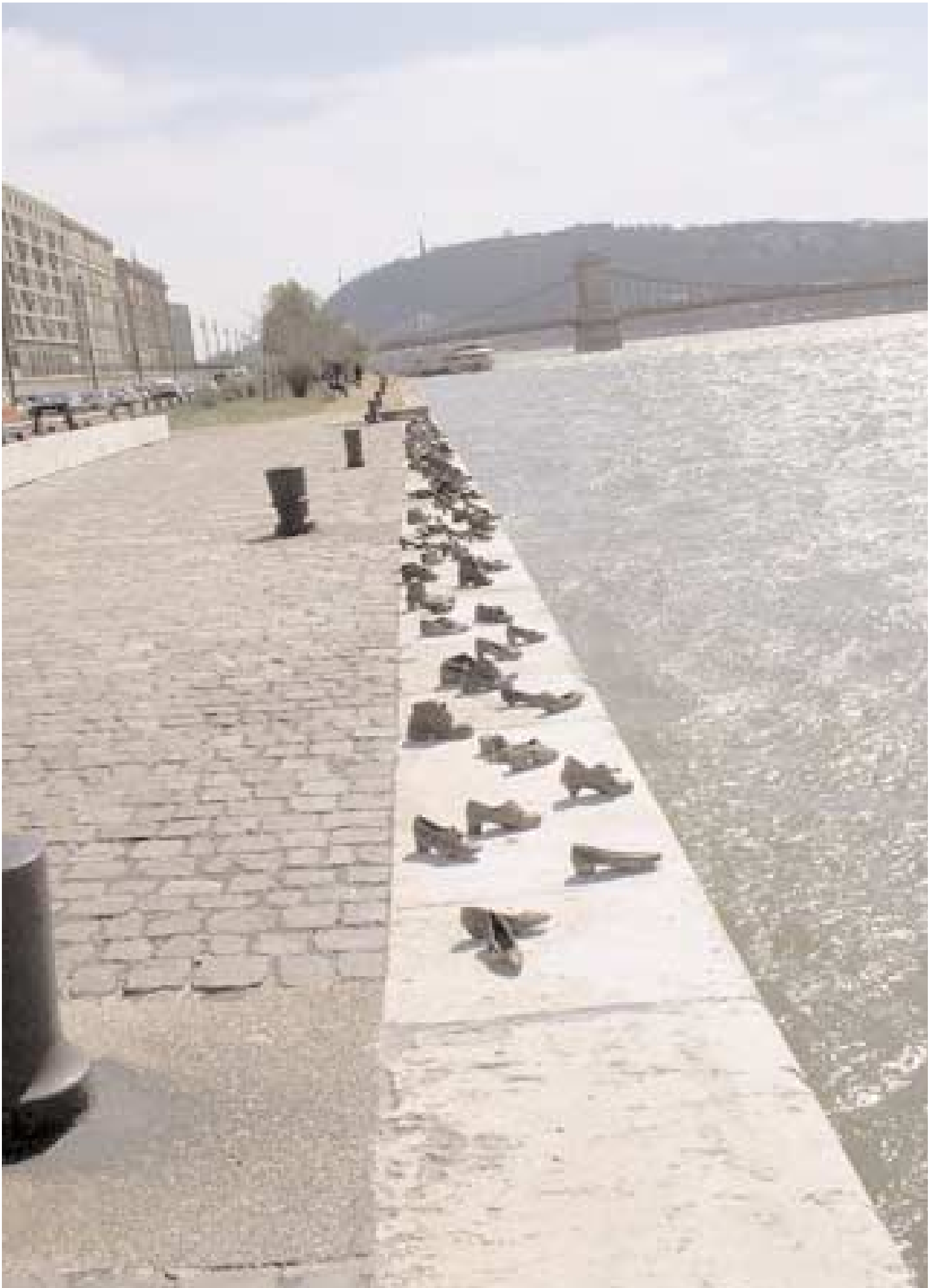
Cipők a Duna-parton, Budapest, 2005 (Szjsz511)