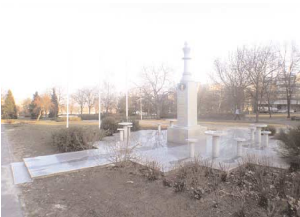
Sakkolimpiai Emlékmű, Paks, 2000 (Szjsz462)