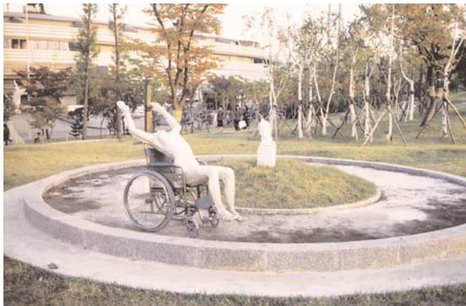
Szöuli torzó , Szöul, 1988 (Szsjsz291)

Pauer a művel egy valóban intermédiális helyzetet modellezett: hogyan lesz köztéri (múzeumi) műtárgy a legszemélyesebből, egy testlenyomatból, majd annak másolata – időt, kulturális és fizikai távolságot áthidalva – hogyan kerül vissza a modell privát szférájába, s mindezt a helyzetet a művész hogyan transformálja műalkotássá (megrendeléssé). 2002-ben a téma újra aktuális lett művész életében, amikor átmenetileg maga is tolószékre kényszerült. A Magyar Szobrász Társaság alelnökeként a Múcsarnokban rendezett szobrászkongresszuson Óhajítások címmel tíz