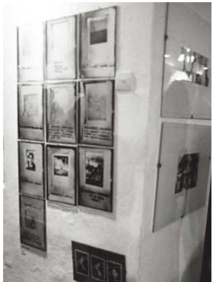
A Doboz, benne 10 fénykép kiállítva az Expozíció. Fotó/művészet című kiállításon, Hatvany Lajos Múzeum, Hatvan, 1976–1977